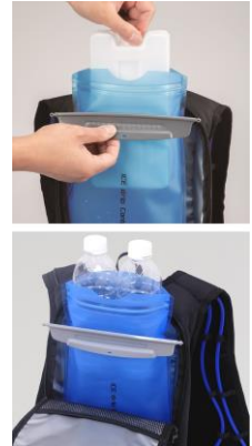
④凍らせたアイスボトルやペットボトルを入れます。