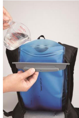
③タンクのファスナーを開け冷水を約 200 ml 入れます。