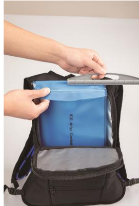
②スライドクロージャーを外します。