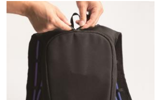
⑥クールベストのタンクファスナーを閉めます