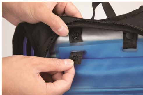
⑥タンク固定ベルトを外します。