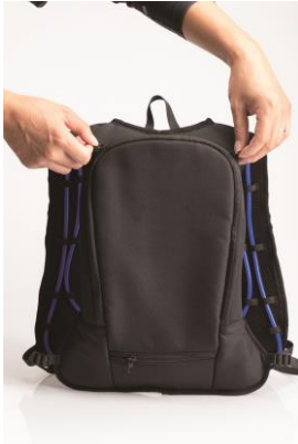
①クールベストのタンクファスナーを開けます。