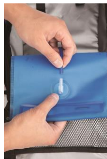
⑦タンク裏のホースを外します。