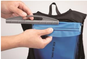
⑤タンクのファスナーを閉めタンクの先端を折り返し、スライドガイドに沿ってスライドクロージャーをスライドさせて取り付けます。