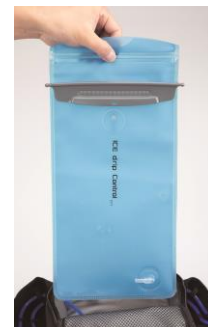
⑧ベストからタンクを外します。