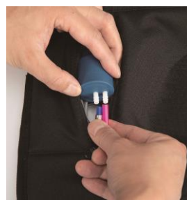
④ポンプからホースを抜きます。(IN/OUT2本)