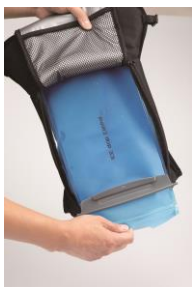
①タンクから水を抜いてください。