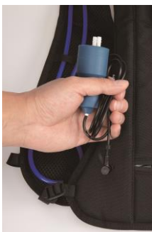
⑤ポンプとケーブルをベストから外します。