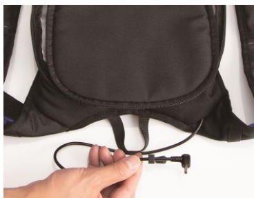
③ケーブルをベストから外します。