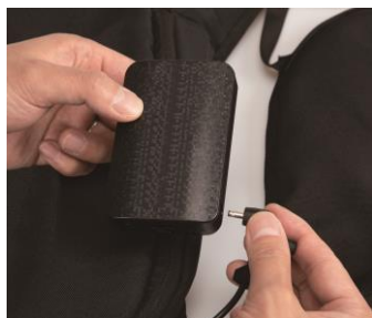
②バッテリーからケーブルを抜き、ベストから外します。